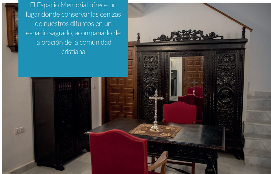
■ Sacristía - Ermita de San Telmo

El Espacio Memorial ofrece un lugar donde conservar las cenizas de nuestros difuntos en un espacio sagrado, acompañado de la oración de la comunidad cristiana