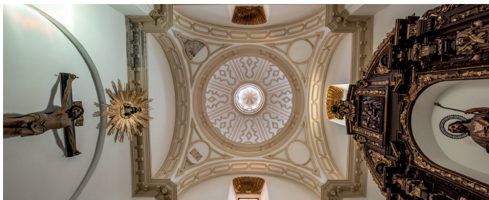
■ Capilla del Sagrario - Ermita de San Telmo

Columbario: “Conjunto de nichos destinado a custodiar las urnas funerarias que contienen las cenizas de un difunto”